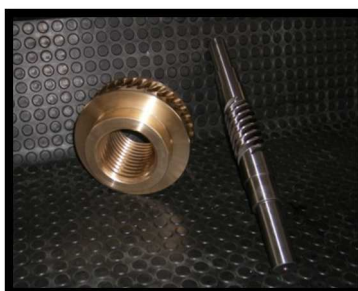
VIS SANS FIN ET ROUE