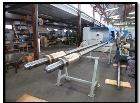
VIS TRAPEZOIDALE Ø100 6m + ECROU