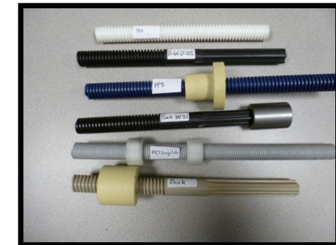
VIS ET ARBRES CANNELES PLASTIQUES