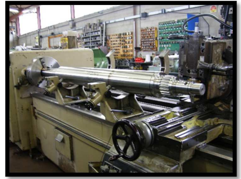
TAILLAGE EXTREMITE ARBRE