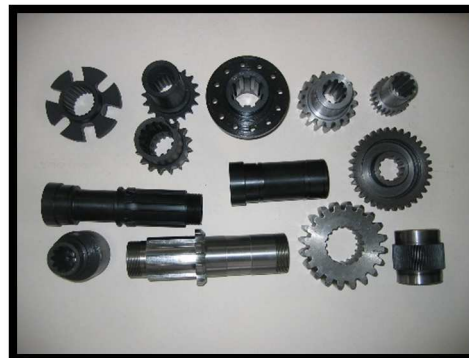
TAILLAGE DENTURE ET MANCHON