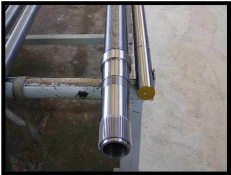
VIS CREUSE AVEC CANNELURES