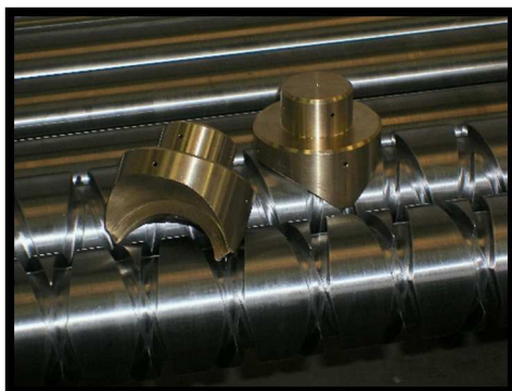
VIS DE TRANCANNAGE ET DOIGT