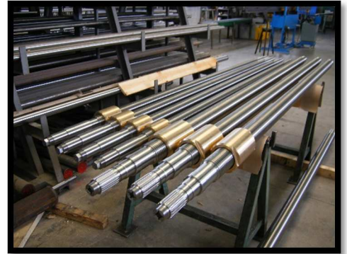
VIS ET ECROU Ø70 L3500 ET Ø90 L4000