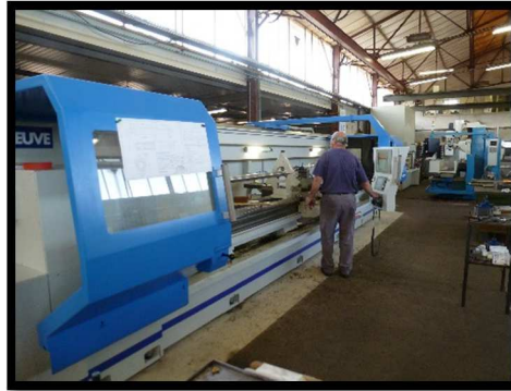
TOUR CN 6000