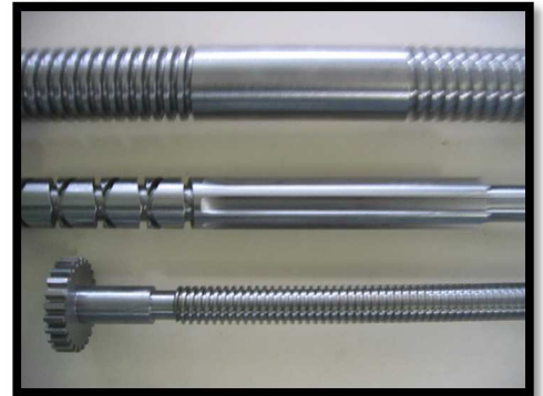
VIS / PIGNON + TRANCANNAGE